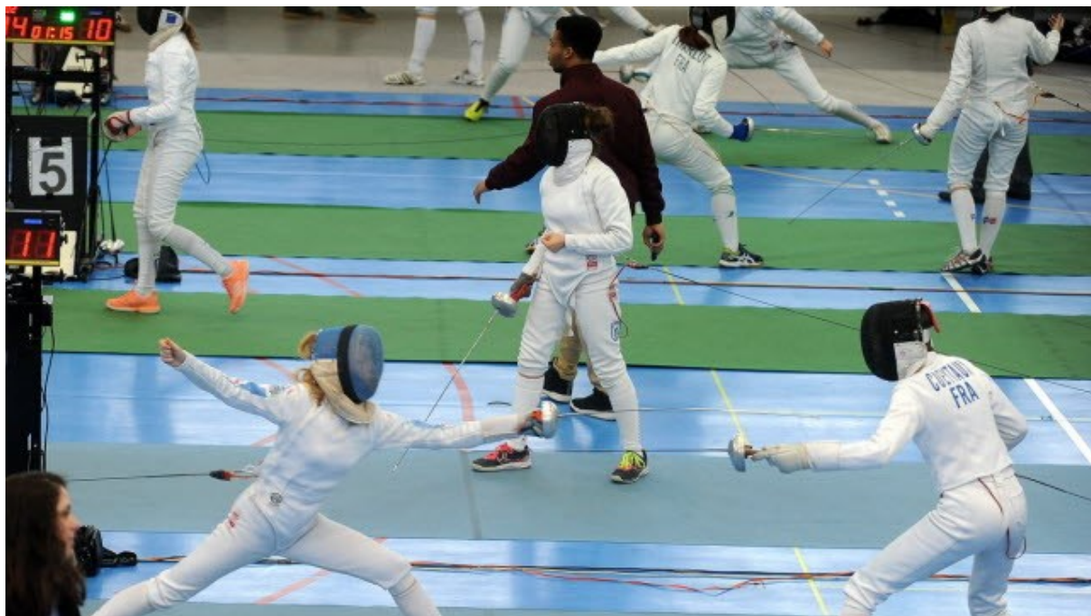
Le club des SR Colmar est désormais bien installé dans le paysage national et accueille des circuits nationaux voire européens.

« En voyant comment les choses se passaient ailleurs, j'avais envie d'aller plus loin, souligne le président Muller, également membre du bureau directeur de la fédération française d'escrime et arbitre international. Tout le monde ne peut pas se targuer d'avoir un tel bilan. J'ai toujours eu cet esprit de challenge. En contrepartie, ça prend du temps au quotidien, on gère plus une entreprise qu'une association. »